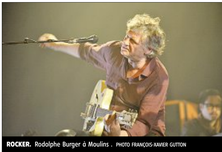
ROCKER. Rodolphe Burger à Moulins.

Le week-end prochain, ce rocker-philosophe va se planter avec sa guitare dans l'oeil du cyclone. Les motos vont tourner au dessus de sa tête pendant que Rodolphe Burger jouera. L'ancien leader de Kat Onoma